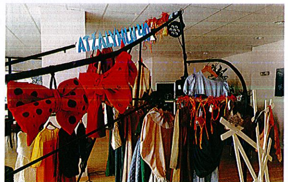
Interaktyvioje parodoje eksponuoti įvairių „Atžalyno“ spektaklių rekvizitai daugelį maloniai nustebe, juk kiekvienas daiktas mena turtingą teatro istoriją.