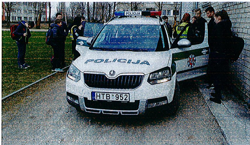
Per pažintinę valandėlę policijos automobilis buvo „ištyrinėtas“ iki smulkmenų.