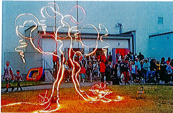
Visus šiemet nustebino švytintis gyvybės medis.

Toks buvo ir prieš „Atžalyno“ teatralizuotą meno šventę prie Vaidilos