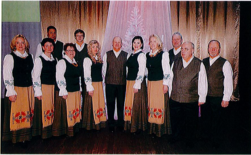
Kolektyvo „Lakštingelė“ nariai – vieningi dirbdami ir būdami kartu.

„Pirmasis krikštas buvo kalėdinė vakaronė. Kaip dabar pamenu, ji vyko šokių salėje. Pakoncertavome ir prasidėjo judėjimas. Veikla užsitęsė iki 5 metų. Kai jau sukako pirmasis jubiliejus, supratome, kad esame įsitvirtinę ir kad reikalingas pavadinimas. Dėl jo būta labai daug pamąstymų. Kol galų gale per vieną renginį padėjome dėžę ir paprašėme žiūrovų siūlyti pavadinimų variantus. Jų buvo daug, tačiau bendru sutarimu pasirinkome „Lakštingelės“ vardą. Gal pavadinimas kiek painus, ypač kai koncertuojame ne Žemaitijoje, bet jis skamba