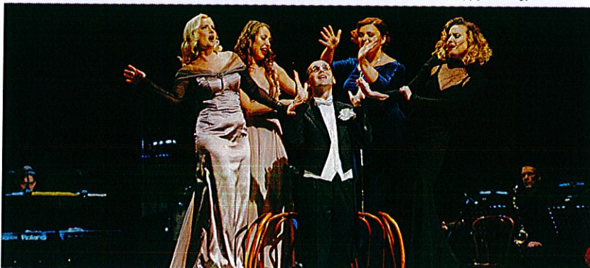
Labdaros-paramos vakaro „Palaimink gerumą...“ dalyviai žiūrėjo Kauno valstybinio muzikinio teatro muzikinį spektaklį „Nutylėtos išpažintys“.

ti daugiau negu trys tūkstančiai eurų perduoti Kretingos ligoninės Akušerijos-ginekologijos skyriui reikalingiems prietaisams įsigyti, 2017 m. paaukoti 3322 eurai padalinti 15 sunkiomis ligomis sergančių miesto ir rajono vaikų.