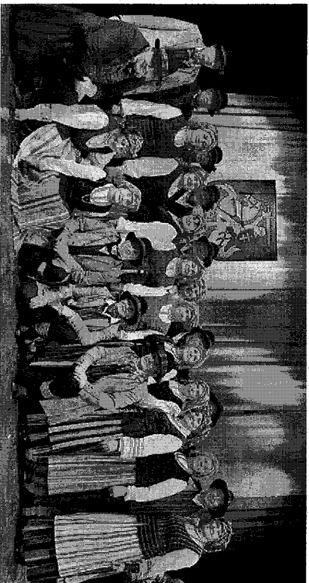
Dalyvis rekordininkas: Kretingos kultūros centro pagyvenusiųjų liaudiškių šokių grupė „Rangė“ i Dainų šventę važiuos jau 12-ąjį kartą.