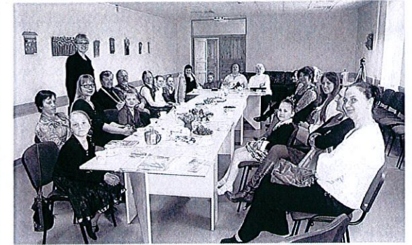
Pirmojo rajone arbatvakario dalyviai tikisi, kad tokios vakaronės taps tradicija.