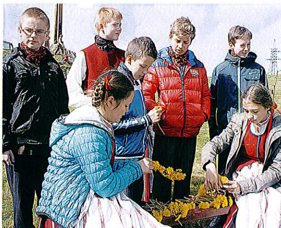
Vainikėlių pynimas – kaimo mergelių priedermė.

Kol protėvių gyventoje darboje prie piliakalnio siautė linksmybės, S. Įpilties bendruomenės moterys virė patiekalus, kurie yra pripažinti kulinarinių paveldu – šilkinę ir žirnių košes, rūgštynių bei dilgėlių sriubą. Pailsusius nuo šokių ir žaidimų, vaišino namine gira.