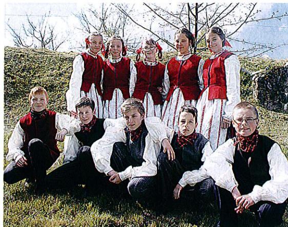
Etnokultūros būrelio „Zemaitoka“ nariai prie liepaitės, kuri buvo specialiai pasodinta Gegutės šventei įprasinti.