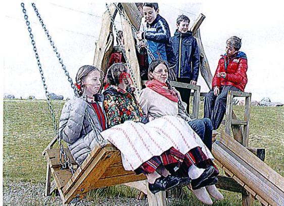
Linguotis sūpuoklėse – sena Gegutės šventės tradicija.

Ji gegutę pavadino paukšte burtininke – mat šioji gieda visai kitaip negu kiti giesmininkai, o savo pavasarinę dainą gali ir ateitį išpranašauti.